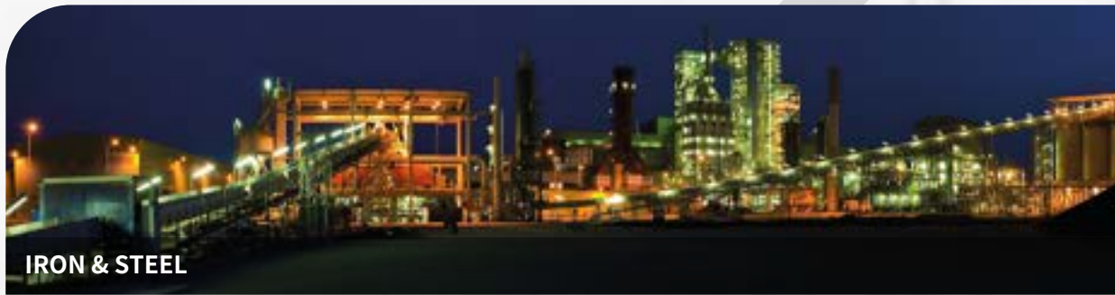
IRON & STEEL